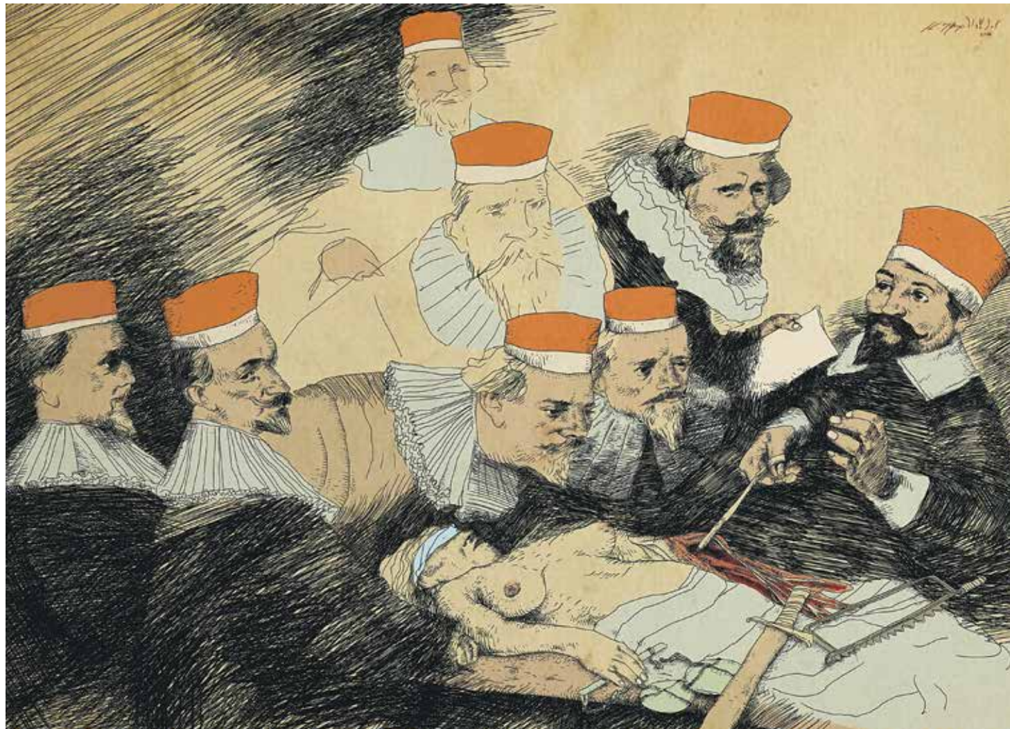
Κωνσταντίνος Παπαμιχαλόπουλος, Το πτώμα της Δικαιοσύνης . Εμπνευσμένο από το Μάθημα ανατομίας του Ρέμπραντ. Στα σύνεργα περιλαμβάνεται και το πριόνι του Ένσορ από το σατιρικό έργο του Οι σοφοί δικαστές .

Με δυο λόγια, τους καταθέσαμε το DNA και δεκάδες αποτυπώματα του σταλινισμού του και αυτοί ισχυρίζονται ότι δεν αποδεικνύουν ούτε καν τον θαυμασμό του προς τα κομμουνιστικά καθεστώτα! Τους ζητήσαμε με εξώδικες προσκλήσεις να μας στείλουν τα