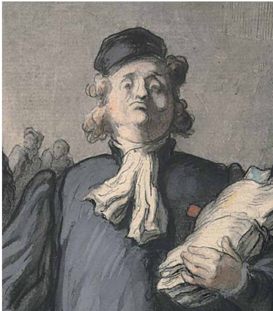
Ονορέ Ντωμιέ, Η μεγάλη σκάλα στο Μέγαρο της Δικαιοσύνης (λεπτομέρεια) , 1848, λιθογραφία από τη σειρά Ο κόσμος της Δικαιοσύνης .

Πρόκειται για χωρίο που επιβεβαιώνει την ανάγκη να διατηρηθούν ή και να εισαχθούν ορισμένα μαθήματα γενικής παιδείας στις Νομικές Σχολές αλλά και στη Σχολή Δικαστών. Έτσι, ίσως αποφευχθούν παρόμοια μαργαριτάρια στο μέλλον, που δηλώνουν σύγχυση περί τα πραγματικά περιστατικά και αδυναμία ερμηνείας τους. Και δεν αναφέρομαι