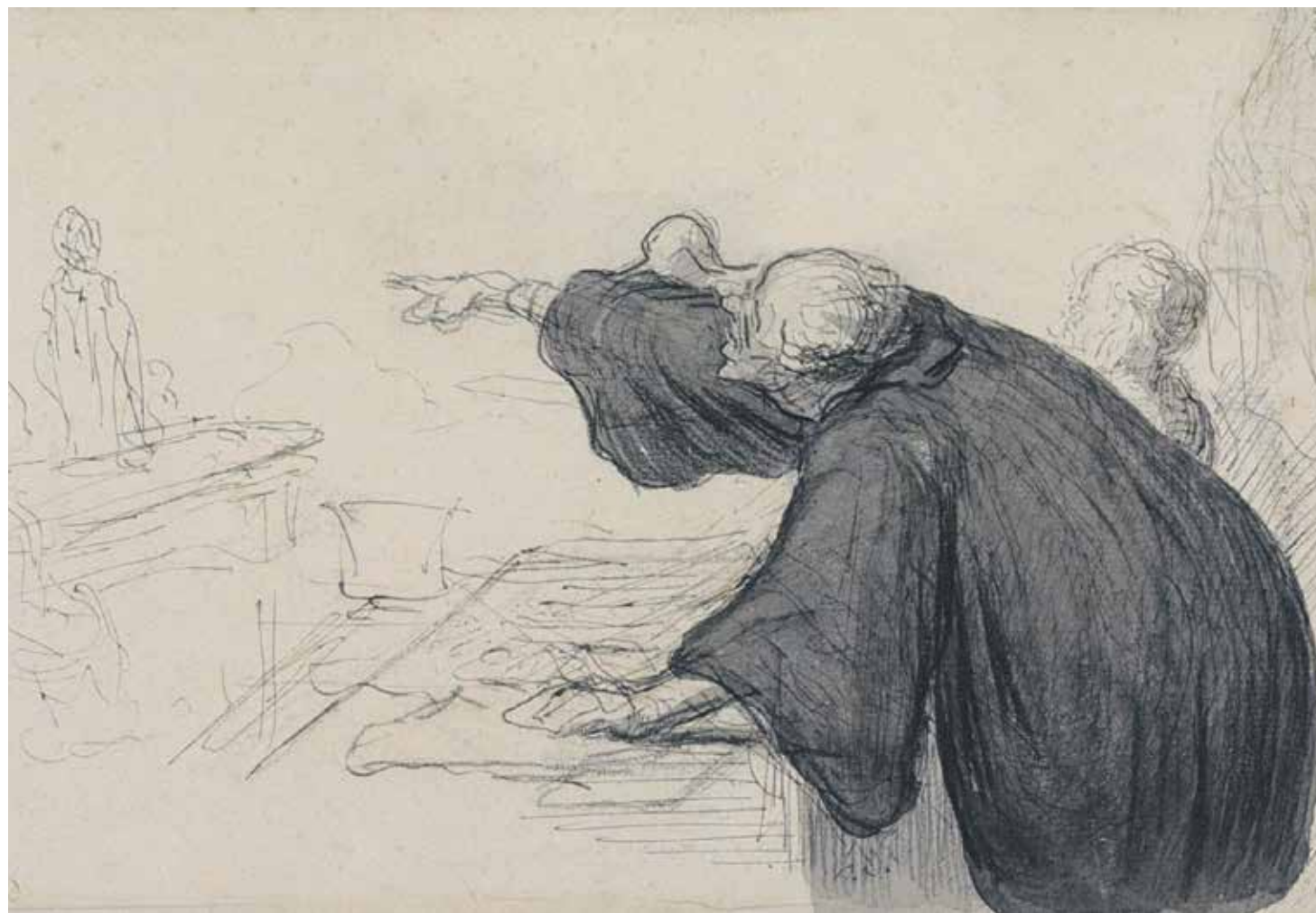
Ονορέ Ντωμιέ, Το πέρας της αγόρευσης, μαύρη κιμωλία, πένα και μαύρο μελάνι , περ. 1860-1870.

Σε μία εποχή που όλοι προσδοκούμε από τις ηγεσίες, πολιτικές ή άλλες, του τόπου να ξεχωρίζουν με την παρουσία τους, είναι αποκαρδιωτικό να διαπιστώνουμε ότι δικαστικές αποφάσεις στοιχειοθετούνται με βάση την άγνοια. Διότι πώς αλλιώς μπορεί να χαρακτηριστεί η άποψη ότι κάποιο άτομο γεννημένο το 1950 υπήρξε ιδρυτικό μέλος του Κομμουνιστικού Κόμματος, που ιδρύθηκε το 1924; Ή ακόμη πώς μπορεί να αιτιολογηθεί η αντίληψη ότι ένα στέλεχος του ΚΚΕ, δεν συμμετέχει στην προώθηση των αρχών του κόμματος του οποίου φέρεται να είναι «ιδρυτικό μέλος», πολύ δε περισσότερο να μην ασπάζεται τις απόψεις αυτές; Τι κύρος μπορεί να έχει μία απόφαση δικαστηρίου που εμπεριέχει τέτοιου τύπου