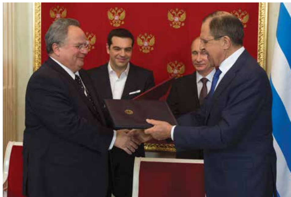
Στιγμιότυπο από την υπογραφή μνημονίου συνεργασίας στο Κρεμλίνο στις 8 Απριλίου 2015. Αριστερά ο Κοτζιάς, δεξιά ο Σεργκέι Λαβρόφ. Πίσω τους ο Τσίπρας και ο ρώσος πρόεδρος Βλαντιμίρ Πούτιν.

Η Γερμανία παίζει τον ρόλο του «Αυτοκρατορικού Κράτους» στο EAT, αλλά αντί για