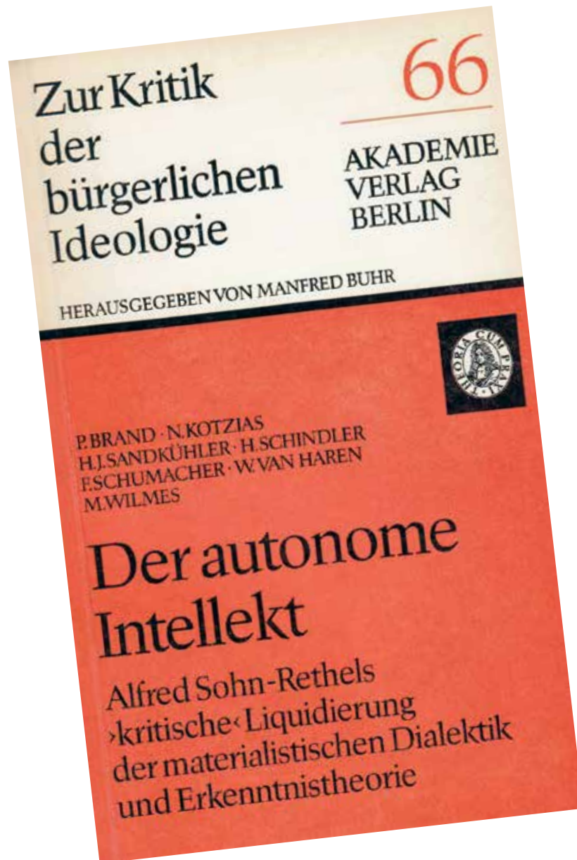
Το εξώφυλλο του βιβλίου Der autonome Intellekt (Ο Αυτόνομος [!!!] Νους) που συνέγραψαν ο Κοτζιάς κ.ά. υπό την καθοδήγηση του Επικεφαλής του Ιδεολογικού Αγώνα της δικτατορίας Χόνεκερ, Μάνφρεντ Μπουρ (Manfred Buhr), πράκτορα και της Στάζι με το ψευδώνυμο «Ελαφοπόδαρος».

Εκτός των άλλων παρατηρήσεων που θα μπορούσε κανείς να κάνει, γεννώνται και τα ερωτήματα: Πού και πώς γνωρίστηκε